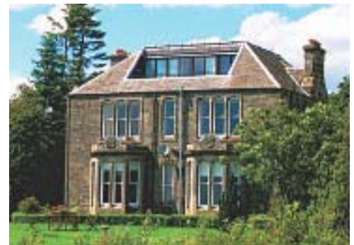
Bankhead House uitzicht tot aan de 2,5 km verderop gelegen stamt uit 1877; boven: