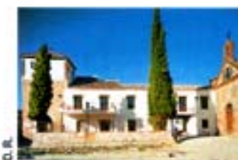
El hotel Cortijo del Marqués ocupa un edificio restaurado.