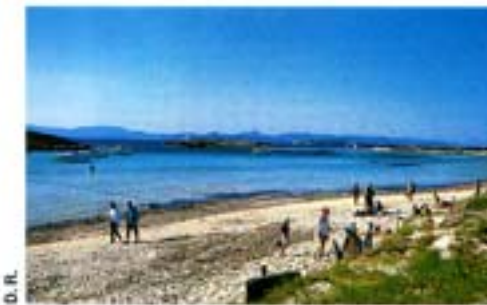
Playa de Ses Illetes (Formentera).

Las distancias cortas y, en temporada baja, el escaso tráfico constituyen todo un aliciente para recorrer Formentera en bicicleta o sobre la moto. Desde San Francisco Javier , la pequeña capital isleña, se puede llegar a los principales puntos de interés. A unos ocho kilómetros, en el extremo sur, encontramos el