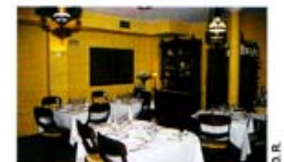
Interior del restaurante Vivaldi.